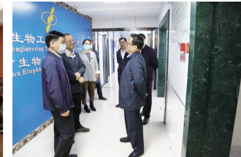
参观点学院生物标志物定量检测河南省工程实验室、河南省生物工程技术研究中心等国家和省市科研平台