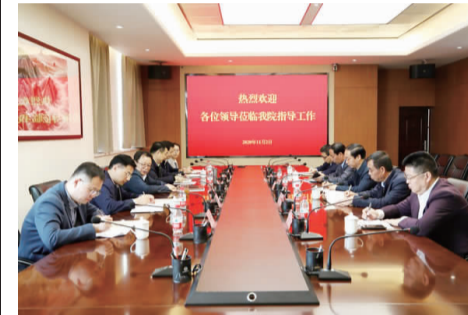
座谈会在学院信息图文中心404会议室举行